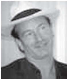
Bono Vox: Kupio minsko polje

Ove godine, za razliku od predhodnih godina, Sarajevo Film Festival je prikazao preko 100 filmova